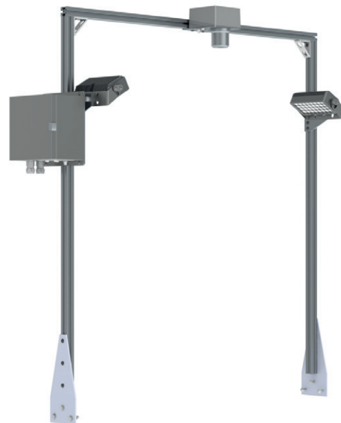
HAVER S INLINE zur Materialanalyse direkt über dem Förderband.

HAVER & BOECKER · Partikelanalyse · Ennigerloher Str. 64 · 59302 OELDE, Deutschland